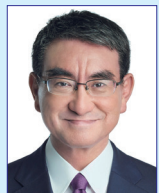
デジタル大臣 河野 太郎