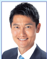
参議院議員 朝日健太郎