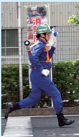
消防団ポンプ操法大会の選手として