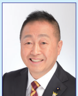
東京都議会議員 鈴木あきまさ