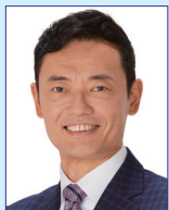
参議院議員 中田 宏