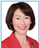
参議院議員 丸川 珠代