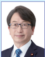
衆議院議員 平 将明